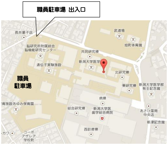
所在地：新潟県新潟市中央区旭町通一番町 757 番地 (新潟大学旭町キャンパス内)

新潟医療人育成センターの場所は、新潟大学医学部の赤門を入れて正面です。 お車で来られる方は、職員駐車場ゲートを無料開放しますのでご利用ください。